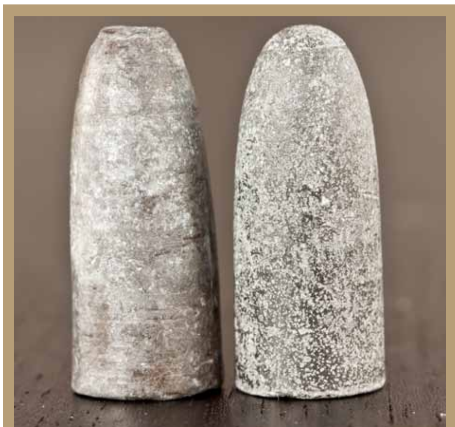
Originalkuler til 4" kammerlader. Den til venstre er støpt, mens den til høyre er kaldpresset. Begge kulene veier 379 grains og er hhv. 28,8 og 28,7 mm lange. Diameteren er rundt 12 mm uten papirvikling.

I tillegg mente de at pistongens plassering under geværet hadde sine ulemper fordi tennhetten av og til falt av. Etter et klikk måtte kammeret åpnes for at en ny kunne settes på, noe som tok tid. Til dette innvendte generalfelttøimesteren at det til dels hadde blitt brukt belgiske tennhetter under forsøkene, og at en tennhette med passende form ikke ville falle av når den var ordentlig påsatt. Skulle det mot formodning kommet et klikk mente nordmennene