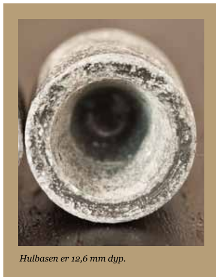
Hulbasen er 12,6 mm dyp.

» Nogle Ord om Infanteriets Skydeøvelser av Paul Sommerschild.