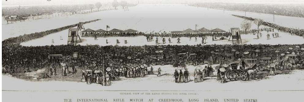
GENERAL VIEW OF THE RANGE DURING THE FINAL MATCH. THE INTERNATIONAL RIFLE MATCH AT CREEDMOOR, LONG ISLAND, UNITED STATES